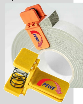
Spezialklammer als Zubehör erhältlich.