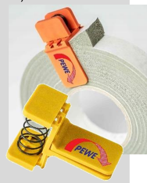
Spezialklammer als Zubehör erhältlich.